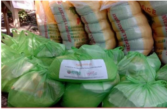
Relief packs composed of rice, mungbeans, driedfish, sugar and sardines, for the family members with 6 or more dependents, the relief pack is doubled